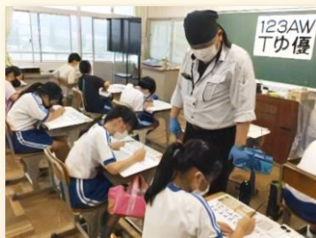
① 小学生の表札作り体験 （広告美術仕上げ職種）

「小中学校などの児童・生徒」や、「地域若者サポートステーションの支援対象となる方」へ、「ものづくりの魅力」を伝えます。体験することでものづくりへの興味を喚起し、マイスターの製作実演や講話で、マイスターの仕事や、体験した技能が仕事の中でどう活かされているかなどを学びます。