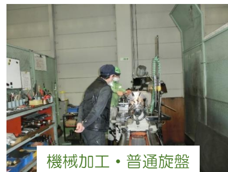
機械加工・普通旋盤

実技指導内容はご希望に応じて、ものづくりマイスターと調整し、現場での指導や座学による講習を行うなど柔軟に対応します。山形県技能振興コーナーまでご相談ください。